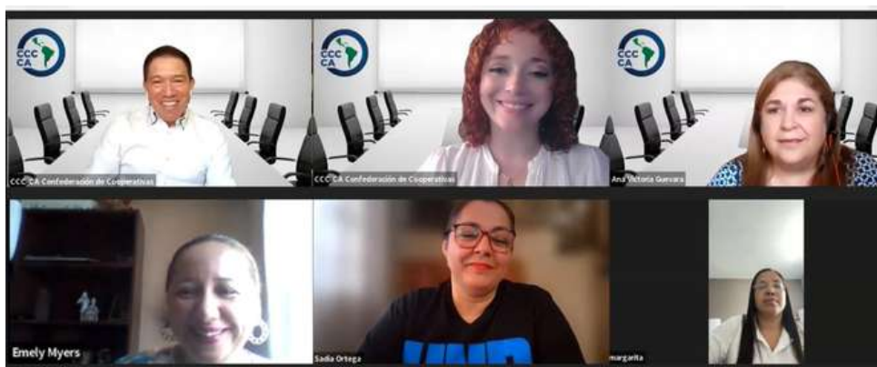
Comité Consultivo NORMA DE IGUALDAD DE GÉNERO (Sector Cooperativo)

¡Agradecemos sinceramente a todas las personas integrantes de estos comités por su valiosa participación y contribución en este proceso de actualización!