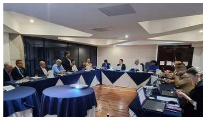
Reunión del Consejo Directivo Regional CDR

En un compromiso constante con la transparencia, la igualdad y el fortalecimiento del cooperativismo, los cuerpos directivos de la CCC-CA marcan un camino sólido hacia un futuro cooperativo más brillante y equitativo.