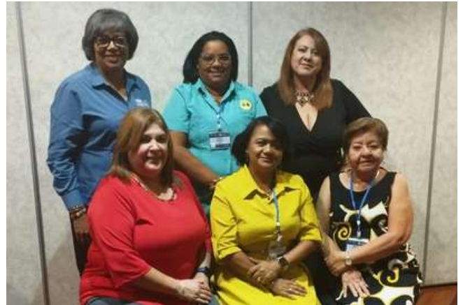
Consejo Regional de Igualdad de Género CRIG

Estas reuniones reafirman el compromiso de la CCC-CA en fortalecer su gobernanza, promover la igualdad de género y abordar estratégicamente los desafíos y oportunidades que enfrenta el cooperativismo en la región.