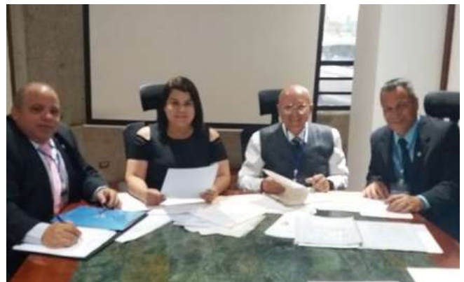
Consejo de Vigilancia CCC-CA