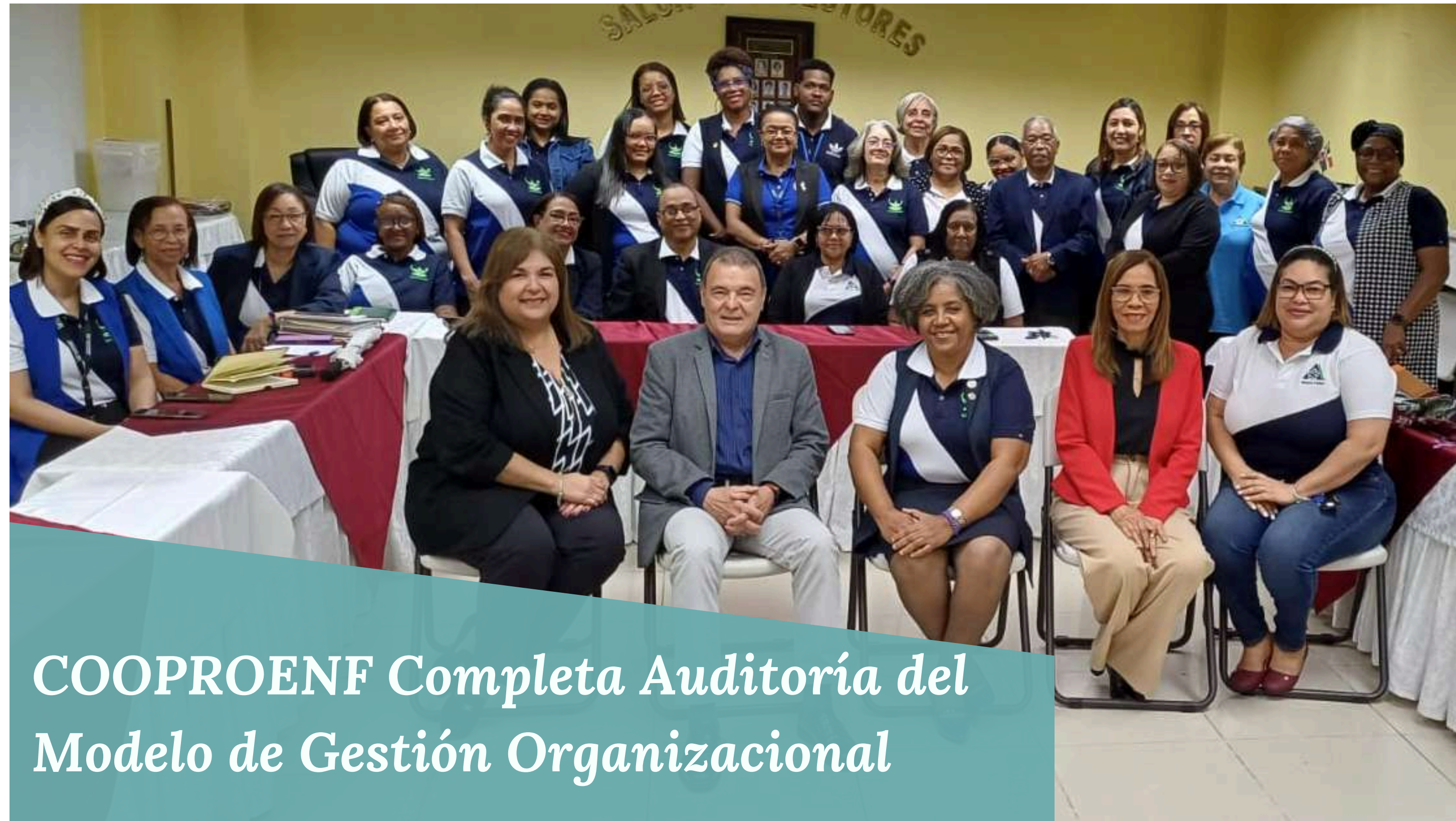
COOPROENF Completa Auditoría del Modelo de Gestión Organizacional

La auditoría, incluyó una visita al distrito 05 San Pedro de Macorís, representando un avance notable en el compromiso de COOPROENF con la mejora continua y la calidad en sus servicios.