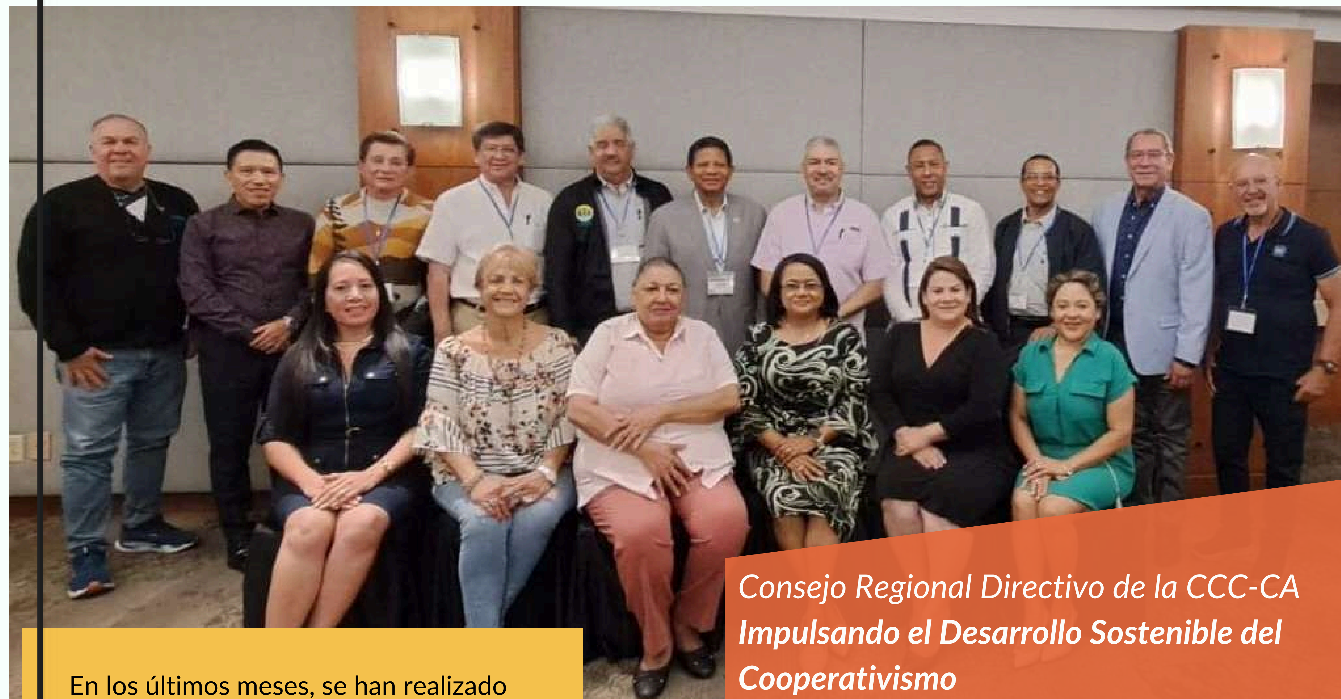
Consejo Regional Directivo de la CCC-CA Impulsando el Desarrollo Sostenible del Cooperativismo

En los últimos meses, se han realizado reuniones clave de cuerpos directivos de la CCC-CA, destacando el compromiso con el desarrollo sostenible del cooperativismo.