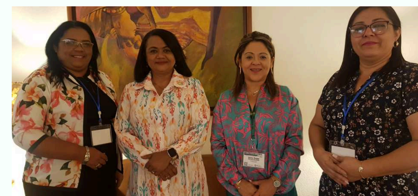
Consejo Regional de Igualdad de Género CRIG