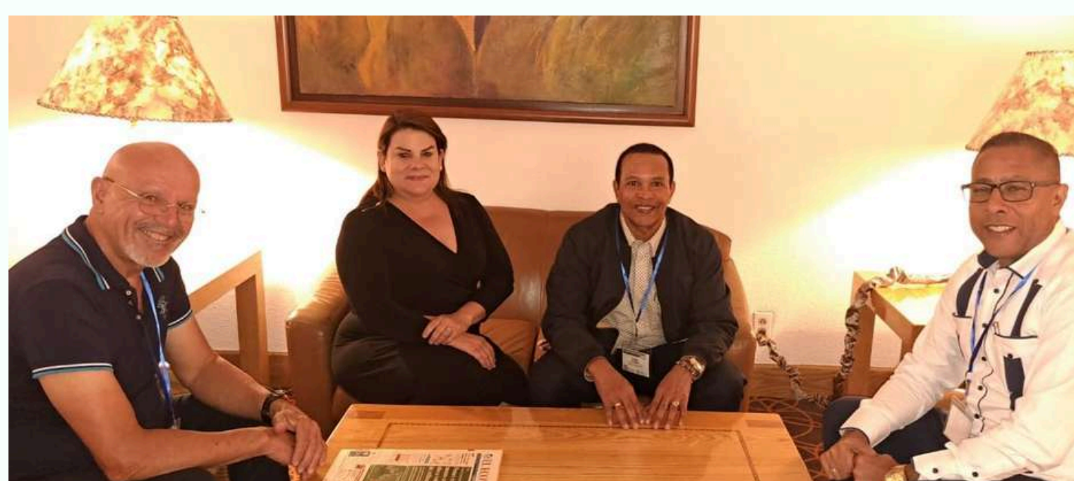
Consejo de Vigilancia CDV

En esta reunión se discutieron temas de relevancia en materia de género, enfocándose en la creación de entornos equitativos y la promoción de una participación integral igualitaria en todas las áreas del cooperativismo latinoamericano.