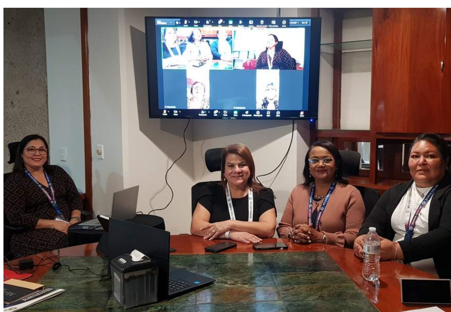
Consejo Regional de Igualdad de Género (CRIG) Participación equitativa por la igualdad