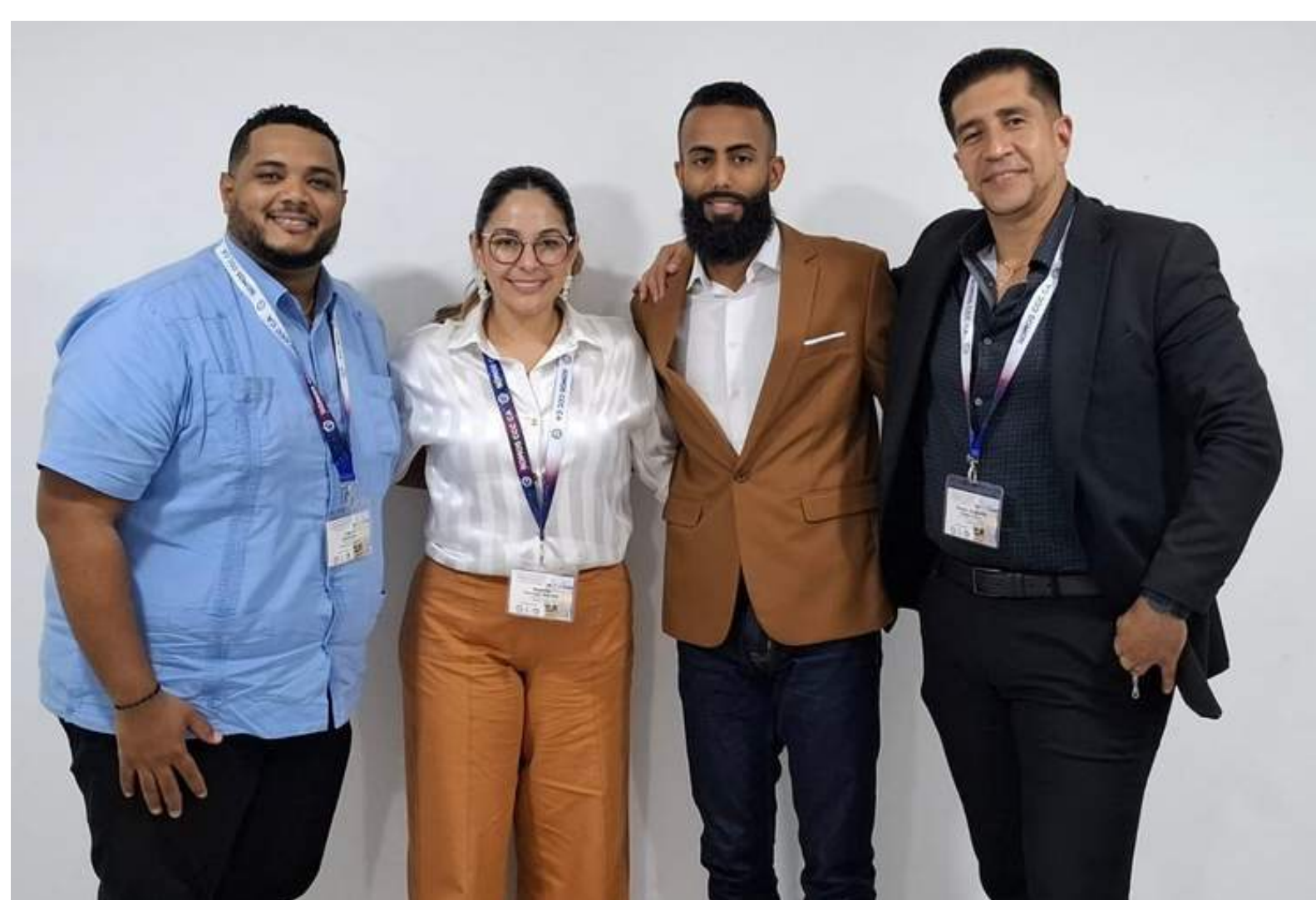
Consejo Regional de Juventud Cooperativista (CRJC) Innovación y liderazgo joven

En el marco del Congreso Ideológico Estratégico “Cooperativismo en el Siglo XXI: de la realidad actual a los escenarios de futuro” y de la XVI Asamblea General Extraordinaria, los cuerpos directivos y consejos regionales reafirmaron su compromiso con una gobernanza democrática, participativa y transparente, mediante sesiones para el seguimiento de agendas estratégicas.