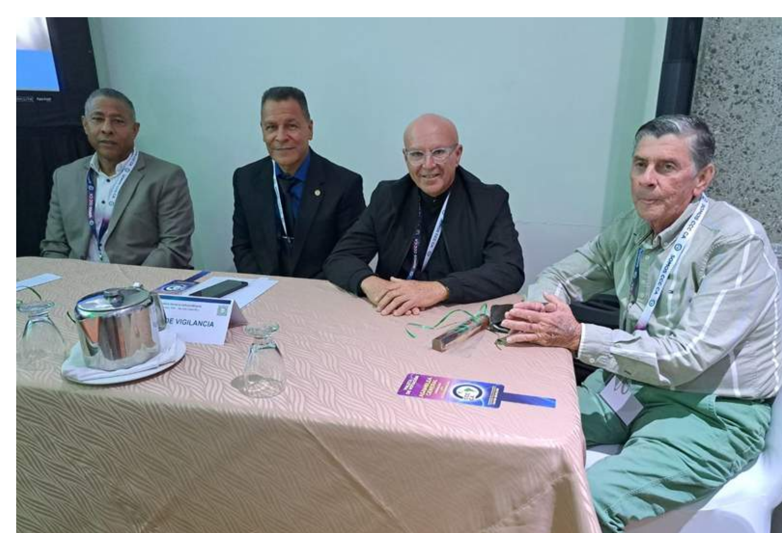
Consejo de Vigilancia (CVD) Transparencia y cumplimiento